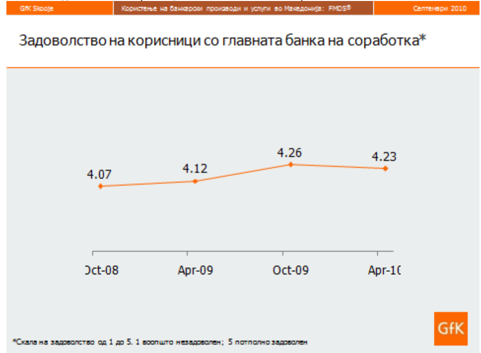
Слика 3: Задоволство на корисници со главната банка на соработка

За истражувањето: GfK FMDS® – континуирано полугодишно истражување на банкарскиот пазар во Македонија од 2008 година. Освен преглед на главните индикатори за познатост на банки, забележаност на реклами за банки, ги пратиме и облиците на однесување на клиентите (со која банка соработуваат, која е главна банка, што од банкарските производи и услуги користат, што имаат намера да почнат да користат), како и индикатори за лојалност и доверба во банките. (n=1000 испитаници во секој круг; анкета лице во лице по домаќинства)